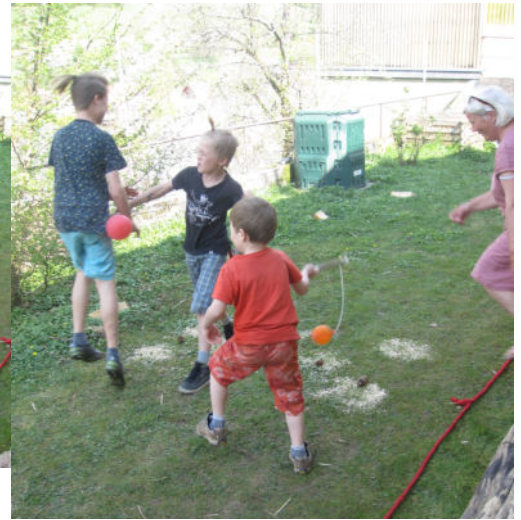
Ostern in Eichen